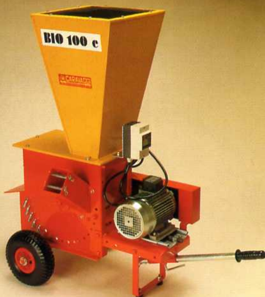
Bio 100 elettrico