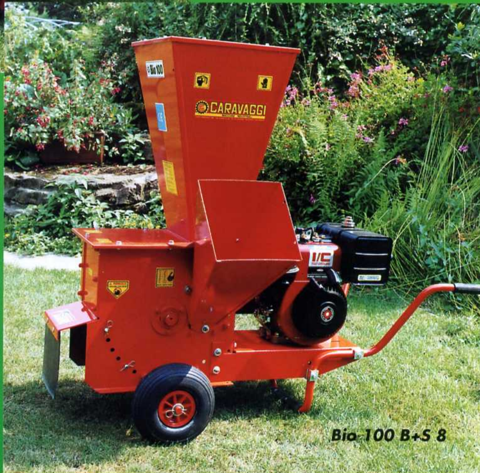
Bio 100 B+S 8