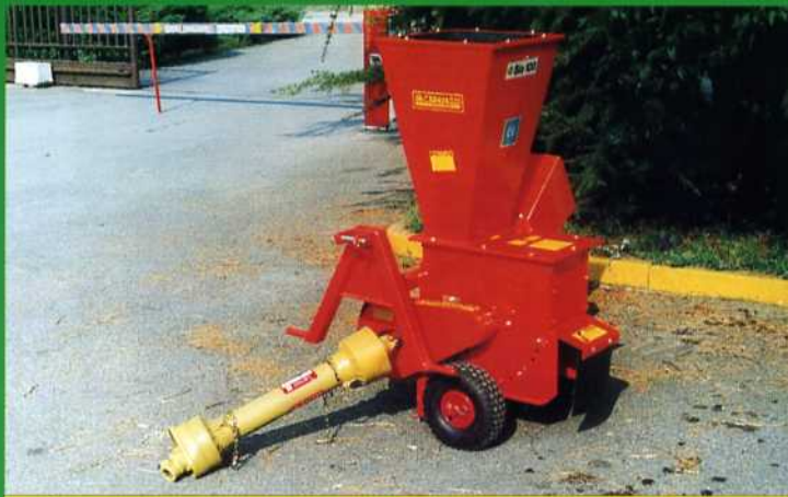
Bio 100 CON ATTACCO TRATTORE