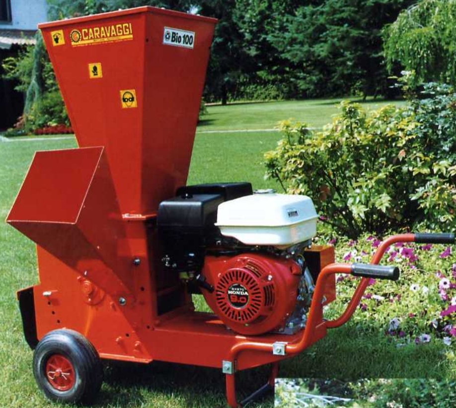
Bio 100 Honda 9