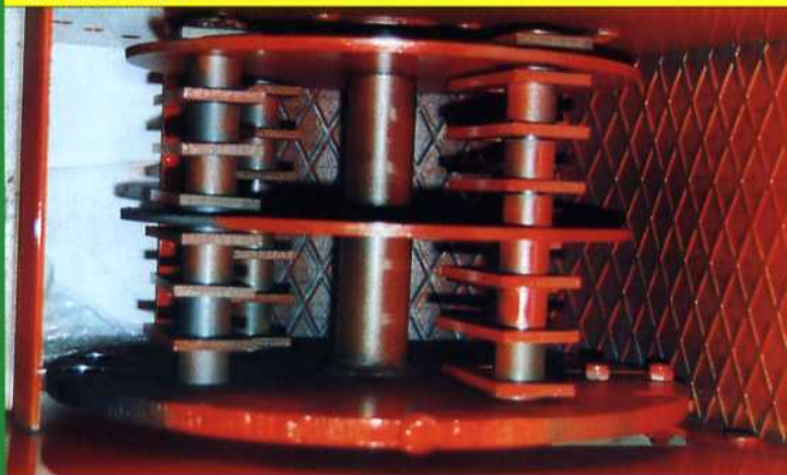
ROTORE A MARTELLI