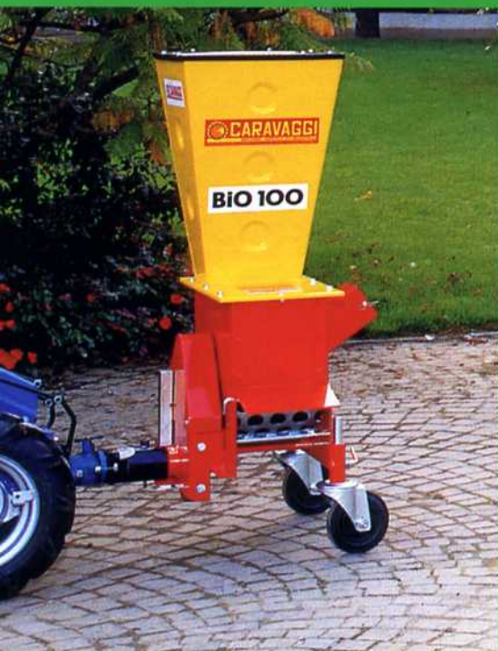
Bio 100 motocoltivatore