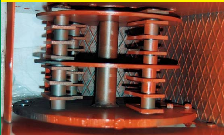
ROTORE A MARTELLI