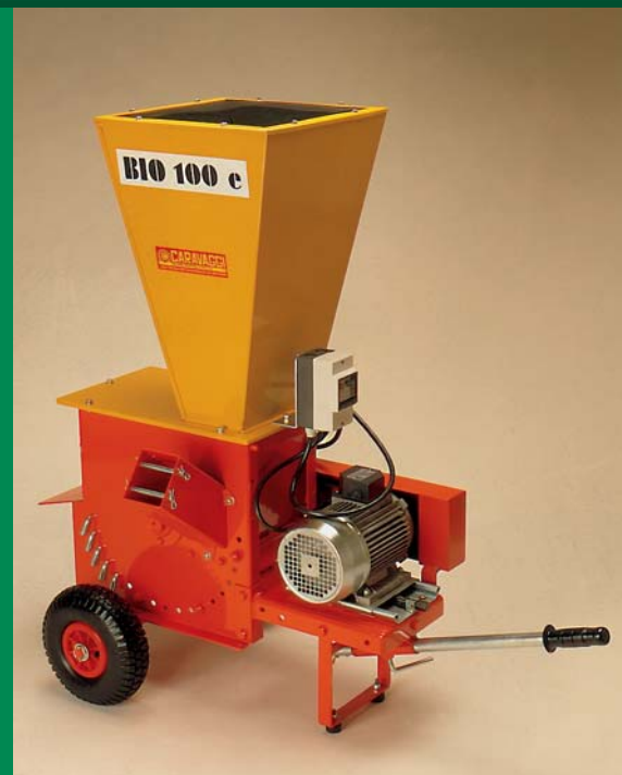
Bio 100 elettrico