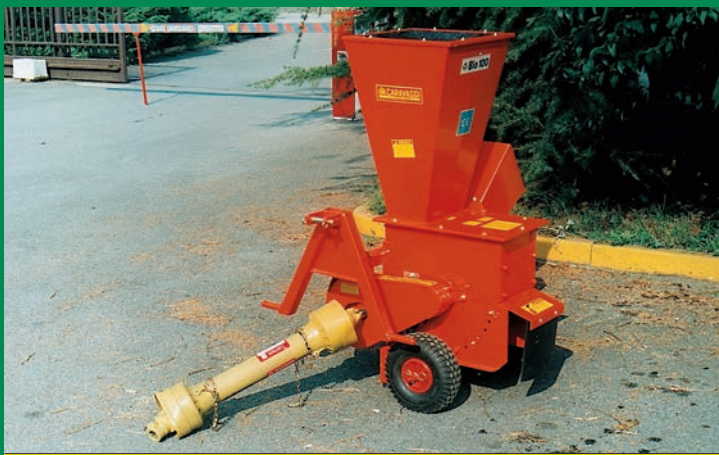
Bio 100 CON ATTACCO TRATTORE