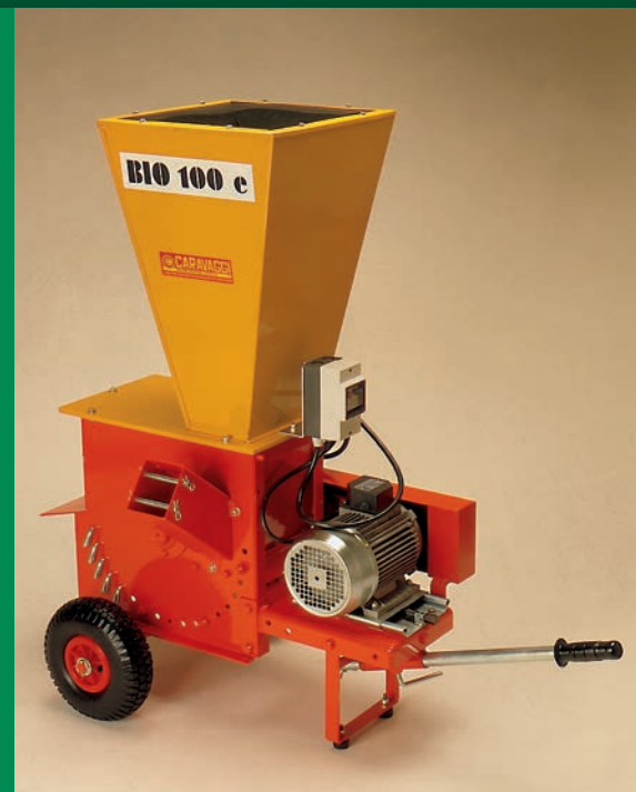
Bio 100 elettrico