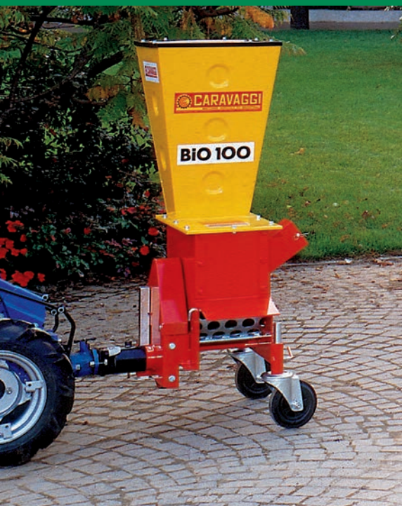
Bio 100 motocultivatore