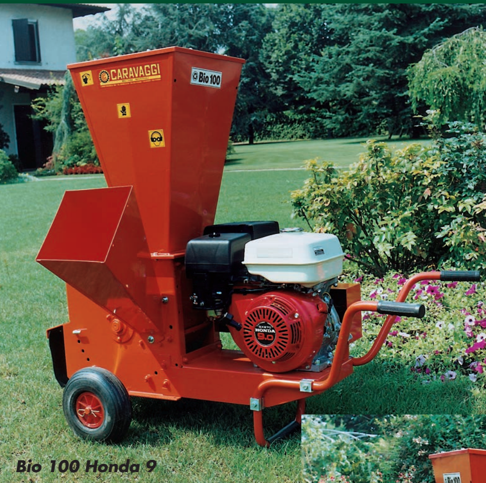
Bio 100 Honda 9