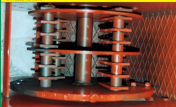
ROTORE A MARTELLI