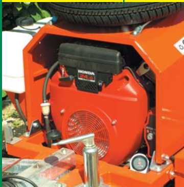
MOTORE BENZINA 24 CV