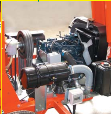
MOTORE DIESEL 27 CV