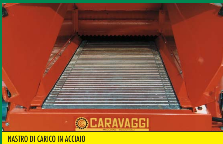
NASTRO DI CARICO IN ACCIAIO