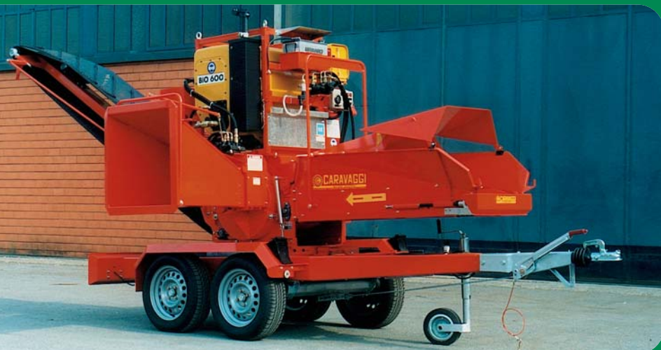
Bio 600 diesel 60 CV con nastro e carrello stradale