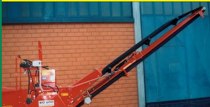
NASTRO DI SCARICO MT. 2,70