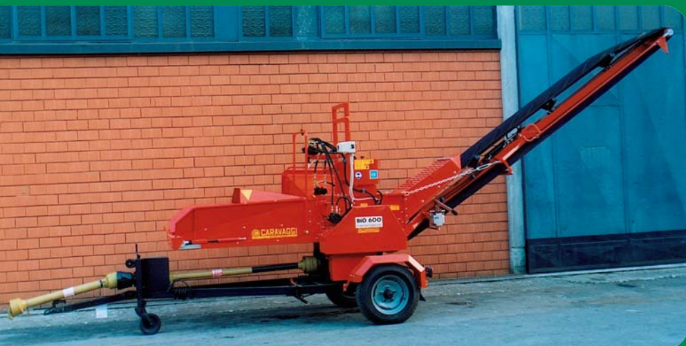
Bio 600 trattore, nastro 2,70 mt e carrello agricolo