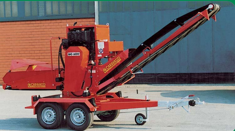
Bio 600 diesel 50 CV con nastro e carrello stradale