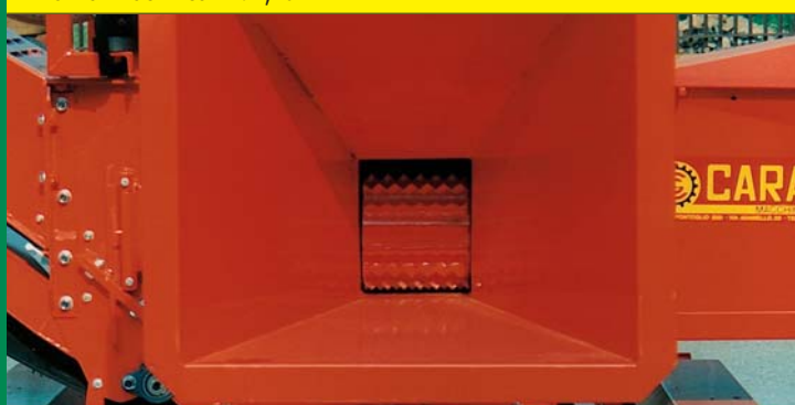
RULLO ALIMENTATORE CIPPATORE