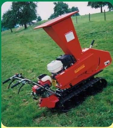
BIO 150 BENZINA SU CINGOLATO