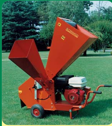
BIO 150 BENZINA -13 CV