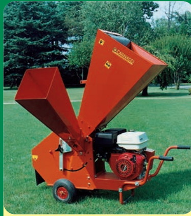
BIO 150 BENZINA -13 CV